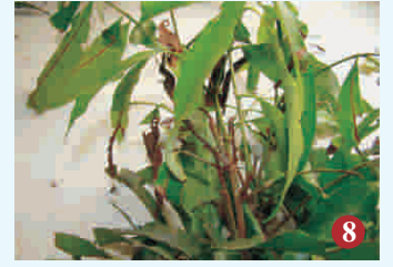
8. टहनी वेधक कीट प्रभावित टहनी