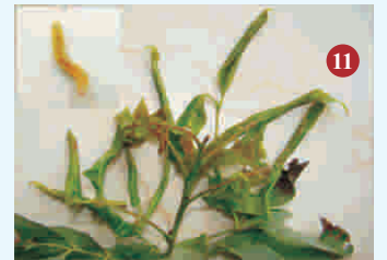
11. पत्ती लपेटक कीट प्रभावित पत्तियाँ और पिल्लू