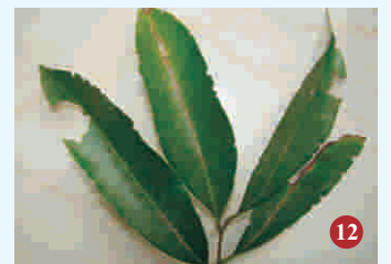
12. पत्ती सुरंगक कीट प्रभावित पत्ती