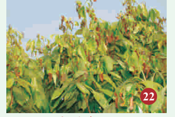
22. पत्ती एवं कोपल झुलसा रोग के लक्षण