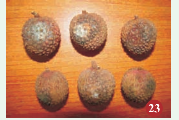
23. फल विगलन रोग के लक्षण