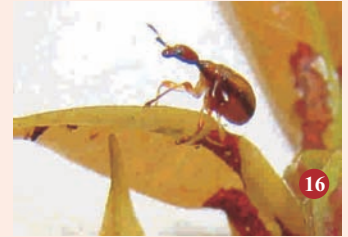
15. लाल सूंडी, 16. प्रभावित पत्तियों का अनुप्रस्थ सिकुड़न