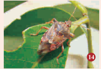
14. लीची बग