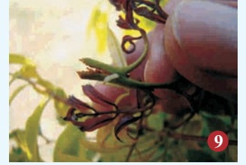
9. प्रभावित टहनी के अन्दर पिल्लू