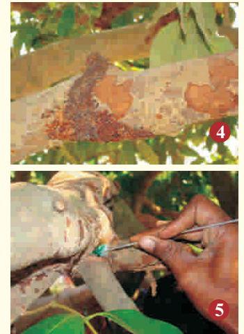
4. छालभक्षी कीट के जाले, 5. कीट की छिद्र में नूवान से भीगी रूई