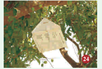
24. लीची वृक्ष पर लगा फेरोमोन ट्रैप