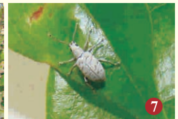
7. पूर्ण विकसित सूंडी