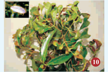
10. मकड़ी प्रभावित पत्तियाँ (इनसेट वयस्क लीची मकड़ी का अभिवर्धित दृश्य)