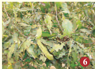
6. सूंडी प्रभावित टहनी