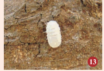
13. वयस्क दहिया कीट

इनके पिल्लू (लार्वा) नई पत्तियों को बहुत तेजी से खाकर उन्हें खत्म कर देते हैं। इसके प्रकोप से अक्सर वृक्ष के छत्रक (कैनोपी) पर प्ररोहों के टूँठ दिखाई देते हैं जिस पर पत्तियों के सिर्फ मध्य शिरे बचे होते हैं। नजदीक जाने पर हजारों की संख्या में सेमीलूपर पिल्लू प्ररोहों पर लटके नजर आते हैं। इसके पूर्ण विकसित लार्वा 1.7–2.2 से.मी. तक लम्बा और 2 मि.मी. चौड़ा होता है जो धुंधला होने के साथ-साथ शरीर पर काले धब्बे लिए हुए होते हैं। इस कीट का प्रकोप सितम्बर-नवम्बर महीनों के बीच होता है। चूँकि इन्हीं कोपलों में अगले वर्ष फूल (मंजर) आते हैं और फल लगते हैं इसलिए इस कीट से बचाव नहीं करने पर उत्पादन में काफी ह्रास हो सकता है।